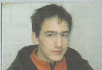
Par Ulysse HUMBERT

nomique, sociale du monde et comment se place la JC par rapport à cela. Nous poserons les questions sur les savoirs et le système éducatif, quelles sont les