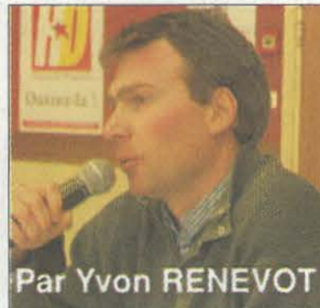
Par Yvon RENEVOT

Les participants ont décidé de poursuivre le débat sur le projet, les candidatures lors d'une deuxième réunion le 8 novembre, avant la rencontre nationale des collectifs locaux des 9 et 10 décembre à laquelle des délégués du collectif participeront. La politique autrement, n'est pas pour les communistes, un slogan mais bien une réalité en acte !