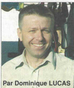
Par Dominique LUCAS

Plusieurs militants issus de différents milieux sont à l'origine de la création d'un Collectif d'Union Populaire sur le Sud-Loire ! L'initiative revient au départ à des militants du Parti Communiste, des militants syndicaux, des militants associatifs ! Entre les 2 premières réunions qui se sont tenues les 3 octobre et 3 novembre, près d'une cinquantaine de personnes se sont réunies, là encore il s'agissait de militants politiques (PC, LCR, Alternatifs) mais aussi de militants de différentes organisations syndicales en leurs noms propres mais connus comme tels (qu'ils soient, de la FSU, de SUD ou de la CGT) ou de militants associatifs ! Les situations professionnelles sont également diverses, ouvriers, enseignants, employés, cadres du privé comme du public mais aussi des Salariés Privés d'Emploi comme des retraités !