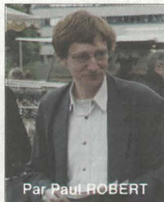
Par Paul ROBERT

Pour cela, nos débats ne doivent pas se limiter aux cénacles militants, il faut gagner la bataille sur deux éléments essentiels pour réussir : ces collectifs doivent être populaires et être constitués au plus proche des quartiers et des entreprises, afin que les salariés, les jeunes, les chômeurs, les retraités puissent s'en saisir pour ne pas se faire voler l'élection. Cela nécessite un Parti communiste ambitieux et dynamique sur ses initiatives propres comme dans les collectifs.