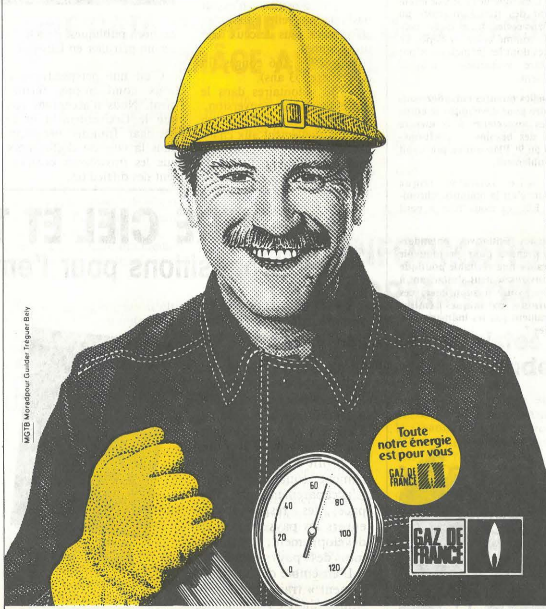
MGTB Moradpour Guider Treguer Bely