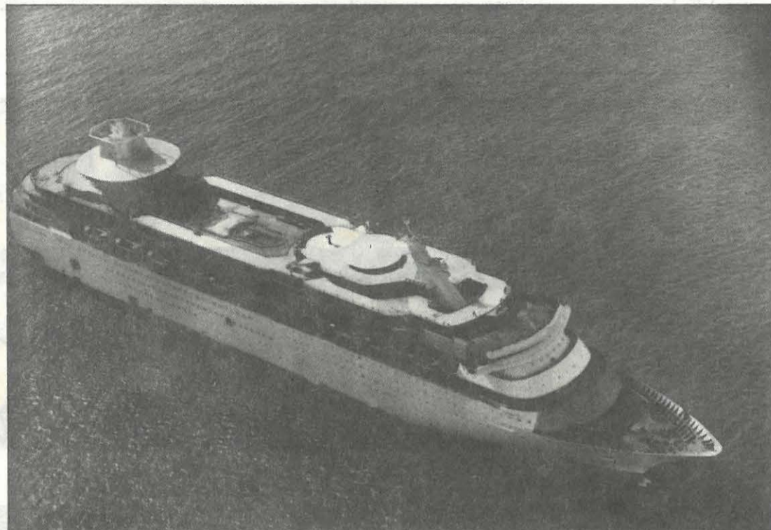
Le "Souverain des Mers", témoin du savoir-faire technologique de la Navale.