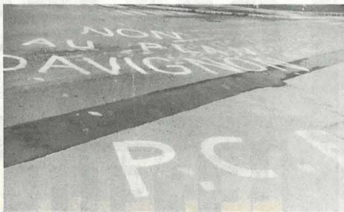
Une longue lutte contre la casse de la Navale.

Pourtant, les infrastructures existent pour accueillir tous types de navires pour y être réparés. « Mais il conviendrait, comme la C.G.T. le fait remarquer, que la cellule commerciale des ARNO ne se