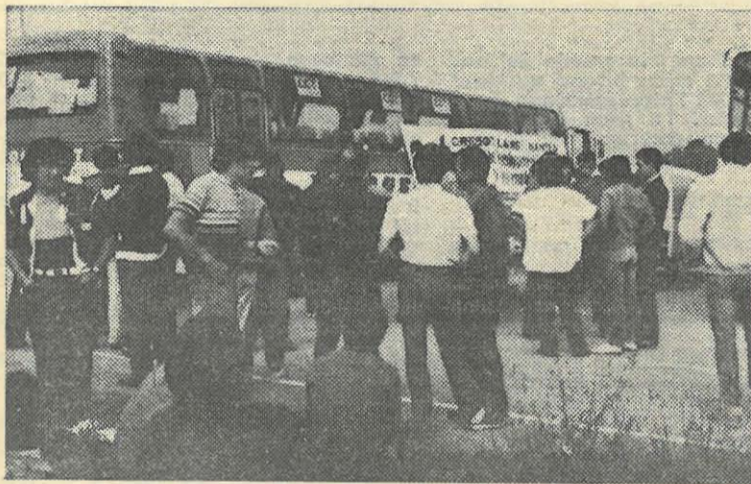
Les travailleurs de l'usine de Nantes sur la route du Creusot en juillet dernier, où ils allaient manifester

Ce n'est donc pas la panacée universelle, comme certains le prétendent, et l'on ne peut s'empêcher de rapprocher l'intensité des prises de positions favorables à la zone franche avec la proximité du scrutin électoral.