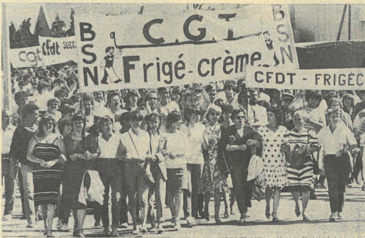
Les femmes de Frigé-Crème lors d'une manifestation pour leur emploi...

La C.G.T. n'est pas prête à accepter de telles remises en cause et sa commission femmes appelle, à l'occasion de ce 8 mars, les travailleuses à signer la pétition qui s'y oppose et par là-même à préparer la 7 e conférence nationale des femmes qui aura lieu à Paris les 13 et 14 juin.