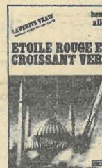
Temps actuels. La Vérité vraie. 85 F.