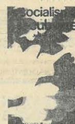
Editions sociales. 70 F.