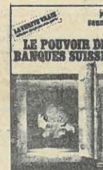
Temps actuels. La Vérité vraie. 85 F.

En librairie : AU LIVRE OUVERT - 21, rue du Calvaire NANTES - Tél. 48-16-93