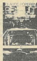
Editions sociales. 60 F.