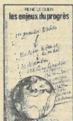
Editions sociales. 65 F.

Pour mieux comprendre : des livres au cœur de l'actualité