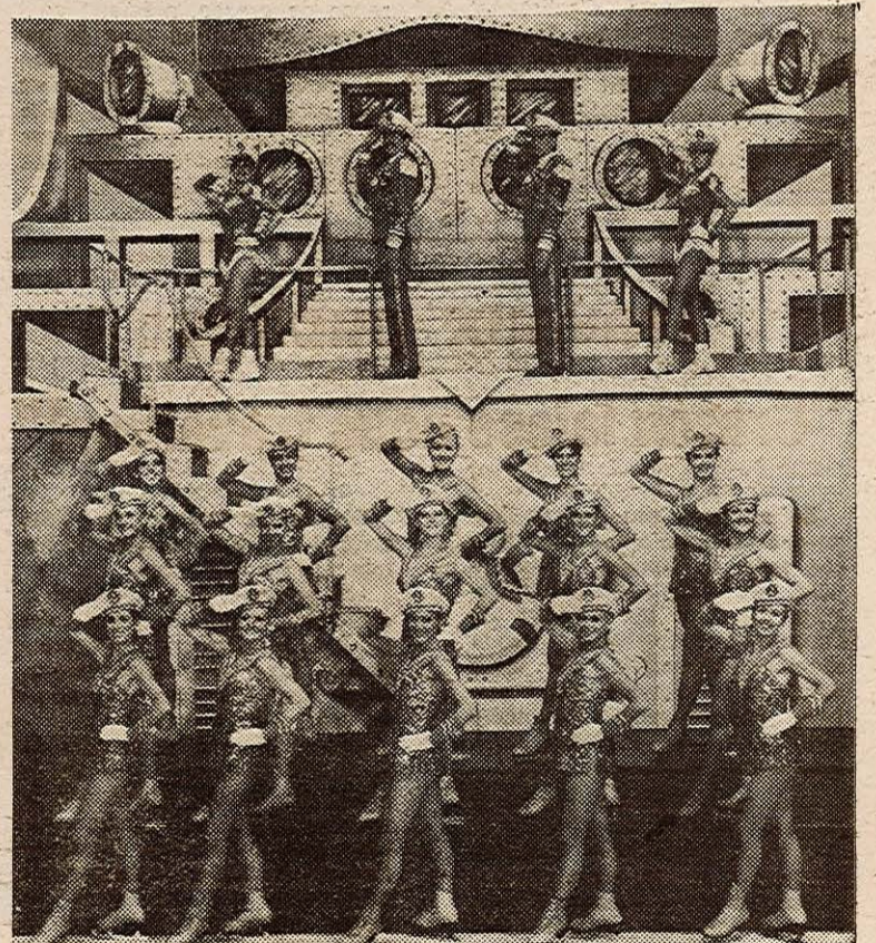
L'ouverture du spectacle : « Voilà la marine... »

Après l'entracte, Holiday on Ice présente « Shangri-La ». Dans ce numéro exceptionnel, de merveilleux solistes accompagnés par le corps de ballet, pénètrent dans un royaume imaginaire, sur une planète lointaine régie depuis plus de 2 000 ans par une reine ravissante mais odieuse qui détient le secret de l'éternelle jeunesse.