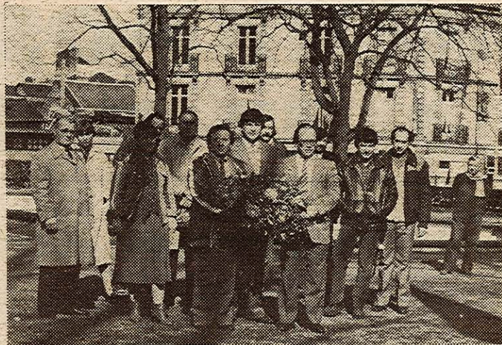
Commémoration du 19 mars.

A St-Nazaire, Couëron, Rezé... les élus communistes participaient aux cérémonies officielles