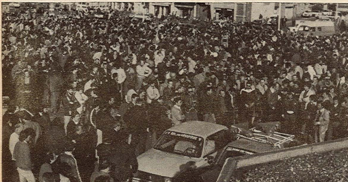
Dès mardi les travailleurs de la Mécanique et de la Navale devaient engager une importante riposte aux prétentions de la direction d'Alsthom, avec une grève de vingt-quatre heures et un meeting d'ampleur sur le terre-plein de Penhoët

Cette situation résulte pour une part appréciable des acquis des luttes, de l'intervention du Parti, qui a toujours rejeté ce paternalisme à l'égard de cette catégorie de population, et refusé qu'elle soit considérée comme un fardeau social.