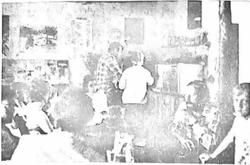
Le bar, agréable et fonctionnel, un moment de détente supplémentaire pour les vacanciers.

« RNUR, château du Petit Bois », entre Mesquer et Quimiac, 8 hectares de tranquillité et de joie de vivre qui accueillent depuis le 3 juillet quatre cent familles de travailleurs.