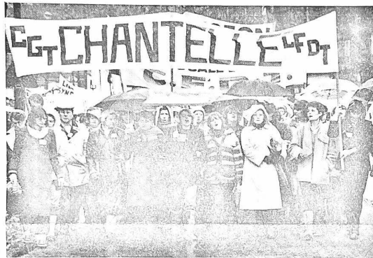
NANTES - ST-NAZAIRE