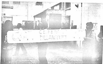
Une importante délégation de chez Renault Billancourt était présente pour soutenir les travailleurs de la SNIAS à la porte de l'usine lundi matin. Ces travailleurs de chez Renault sont actuellement en vacances dans les centres RNUR de Mesquer et la Turballe.